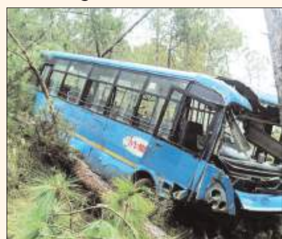
उपचार के लिए भर्ती करवाया गया है। घायलों की संख्या 6

टीम एक्शन इंडिया/मंडी/खेमचंद शास्त्री उपमंडल करसोग के मेहडी करसोग जा रही बस दुर्घटनाग्रस्त हो गई। बस में करीब 37 यात्री सवार थे। इस दुर्घटना में परिचालक समेत छह यात्रियों को गंभीर चोट आई है। पुलिस द्वारा दी गई जानकारी के अनुसार मेहडी से करसोग जा रही थी बस एचपी 03वी 6211 सुबह लगभग 10:15 बजे देउरी धार के पास दुर्घटनाग्रस्त हो गई। यह बस लगभग 300 मीटर नीचे गहरी खाई में गिरी। घायलों को सिविल अस्पताल करसोग में