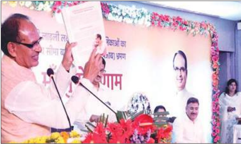
मध्यप्रदेश के मुख्यमंत्री शिवराज सिंह चौहान लाडली योजना पर कार्यक्रम को संबोधित करते हुए।

मुताबिक, 'सावदी के आने से 30 से 35 सीटों पर असर हुआ। लिंगायतों ने कांग्रेस को वोट दिए। इसी से इतनी बड़ी जीत मिली।' इसके बावजूद उन्हें मंत्रिमंडल में शामिल नहीं किया गया। पूर्व सीएम जगदीश शेट्टार को भी मंत्रिमंडल में जगह नहीं दी गई। वे भी लिंगायत कम्युनिटी से आते हैं। हुबली-धारवाड़ सीट से लगातार 6 बार जीते, पर इस बार हार गए। वे तो उनकी बात हुई, जिन्हें पद नहीं मिला।