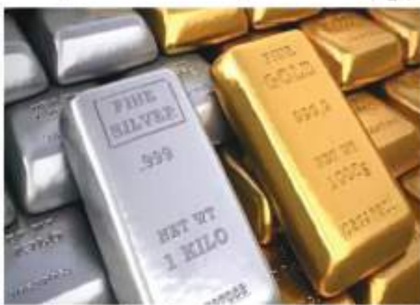
कारण के कारण सोना गिरकर 60,390 रुपये प्रति 10 ग्राम के स्तर पर आ गया। चांदी आज की मजबूती के कारण एक बार फिर

नई दिल्ली। घरेलू सराफा बाजार में लगातार पांचवें दिन सोने की कीमत में नरमी बनी रही। आज की गिरावट के बावजूद सोना 60 हजार रुपये प्रति 10 ग्राम से ऊपर का स्तर बनाए रखने में कामयाब रहा, लेकिन निवेशकों की बेरुखी से कमजोरी के साथ ही कारोबार किया। हालांकि, सोना के विपरीत चांदी ने आज सराफा बाजार में तेजी का रुख दिखाया। आज के कारोबार में सोना नीचे फिसलता हुआ नजर आया, लेकिन चांदी मजबूती का प्रदर्शन करने में सफल रही। सराफा बाजार में आज की नरमी के